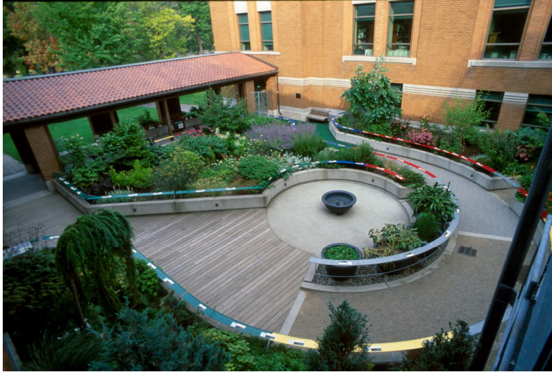
Photo de la cours des sens 2006